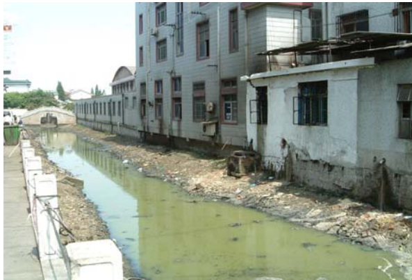
Abwasserkanal in HuaXin und zukünftiger Kläranlagenstandort

Die Stadt HuaXin liegt im Großraum Shanghai. Dieses dicht besiedelte Mündungsgebiet des Yangtze-Flusses ist geprägt von zahlreichen Kanälen und Wasserläufen. Ein Konzept für die Abwasserbehandlung außerhalb der Kernstadt ist im Aufbau. Ein Großteil der anfallenden Abwässer wird unbehandelt in die Vorfluter eingeleitet.